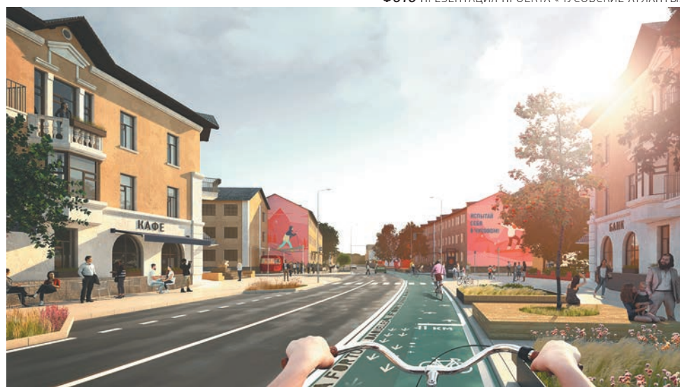
ФОТО ПРЕЗЕНТАЦИЯ ПРОЕКТА «ЧУСОВСКИЕ АТЛАНТЫ»

В марте заявка Чусового была направлена в правительство Пермского края, которое перенаправило её в Минстрой РФ вместе с проектом Губахи по благоу-