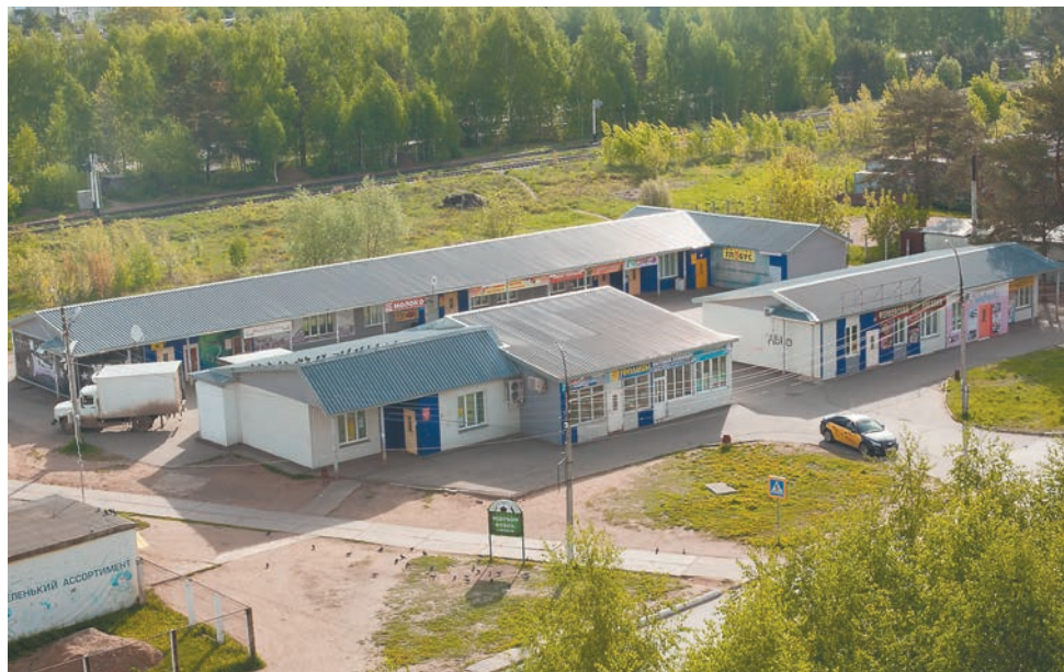
Мини-рынок в микрорайоне Завокзальном расположен по пути в центр города