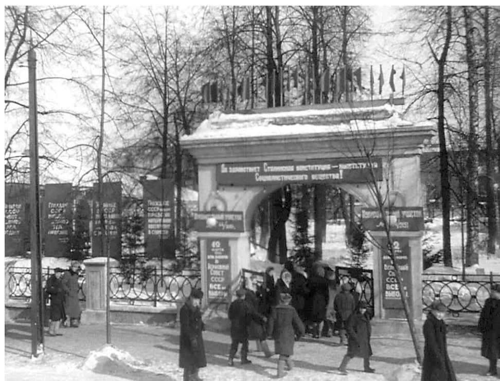
Город Молотов, 1941–1947 гг. Кадры из кинохроники