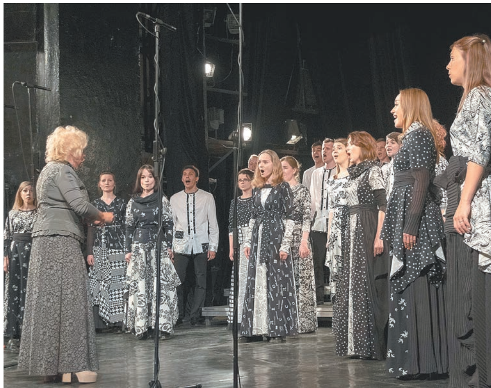
Хор «Млада» на фестивале «Безумные дни»