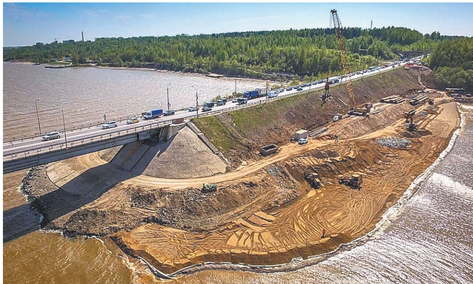
Стоимость строительства нового моста через Чусовую составляет больше 15 млрд руб. Предполагается, что он будет открыт в 2021 году