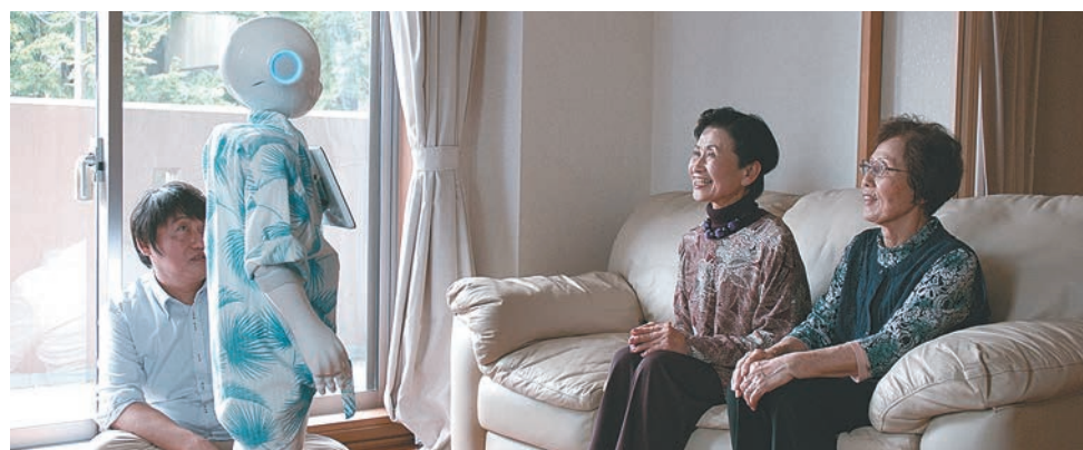
«Привет, искусственный интеллект»

Одна из определяющих характеристик современности — массовая эмиграция. Фильм «На связи» режиссёра Павла Земильского показывает жизнь в эпоху Skype, который становится жизненно необходим в ситуации, когда близкие люди оказываются за тысячи километров друг от друга. Перед зрителем предстают жители небольшой польской деревни Старе-Юхи, расположенной в районе, который часто называют Страной тысячи озёр. С 1980-х годов около трети населения деревни переехало в Исландию на заработ-