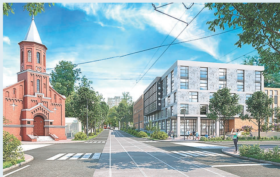
Проект нового корпуса техникума им. Швецова